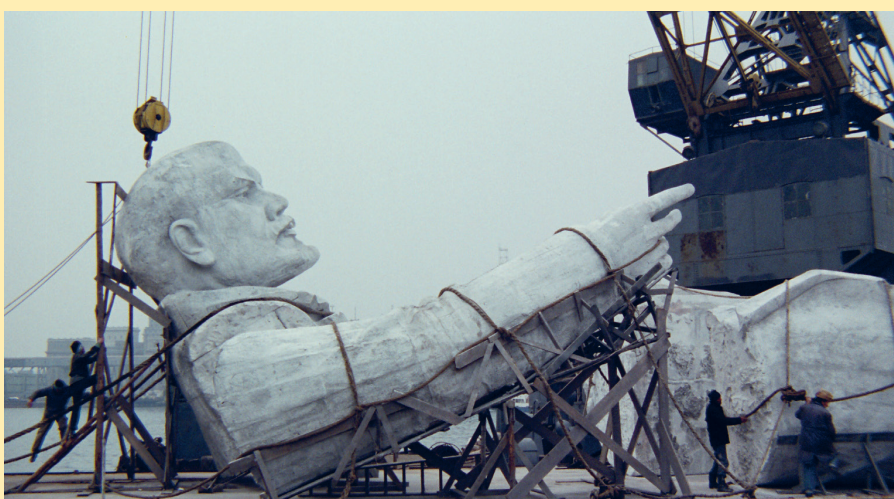
“Traveling Lenin” ( La mirada de Ulises , film de Theo Angelopoulos, 1995).